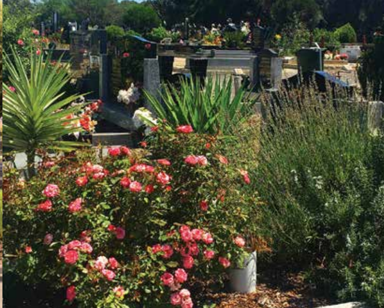
霍德尔伊斯兰墓区, 北区陵园